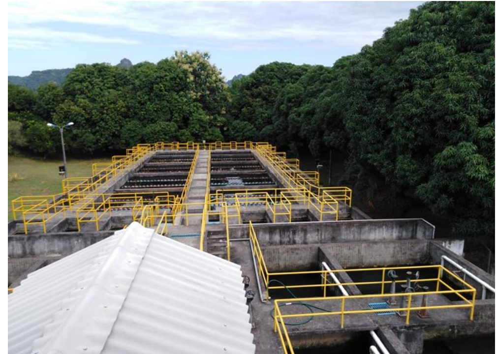
Planta de Tratamiento de Agua El Llano

La Empresa de Obras Sanitarias de Caldas “EMPOCALDAS S.A E.S.P” es una Sociedad Anónima Comercial de Nacionalidad Colombiana, del orden Departamental, clasificada como empresa de servicios públicos, con autonomía administrativa, patrimonial y presupuestal, que se rige por lo dispuesto en la Ley 142 de 1994 y la Ley 689 de 2001.